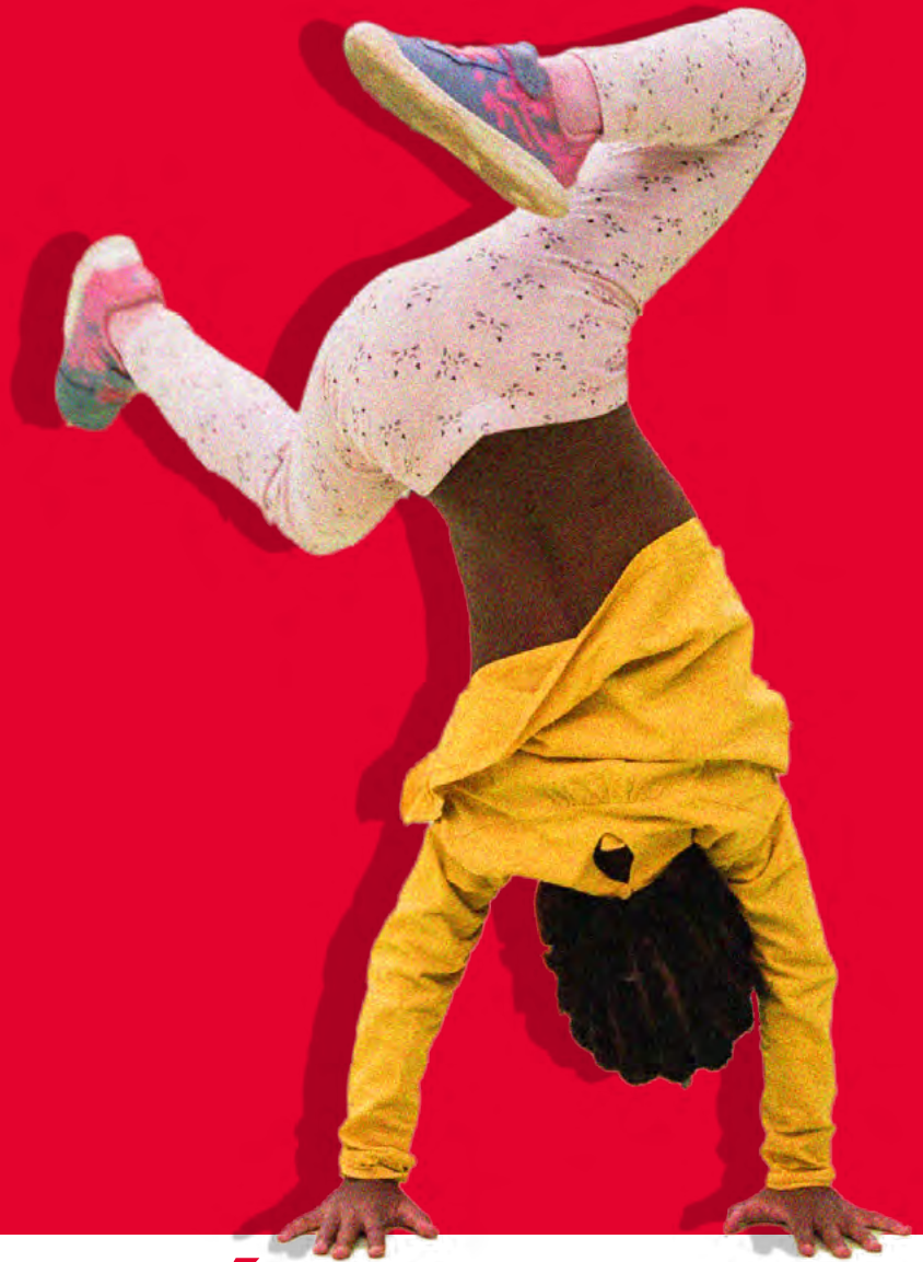
SCHÉMA MÉTROPOLITAIN DES ENSEIGNEMENTS ARTISTIQUES 2023-2027