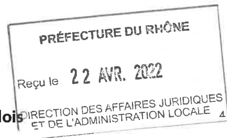
Tableau des emplois